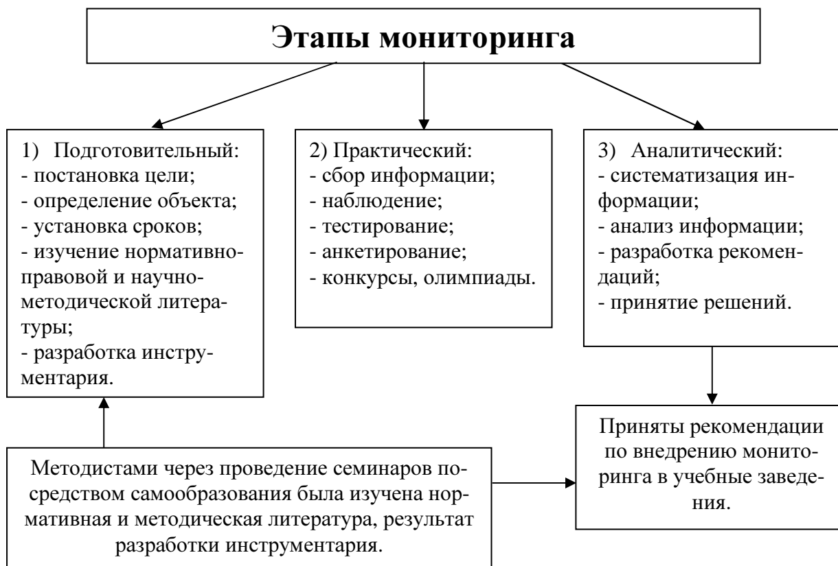
Рис. 3. Элементы мониторинга

Педагогический эксперимент заключался в практической апробации и оценке эффективности деятельности СОСКК.