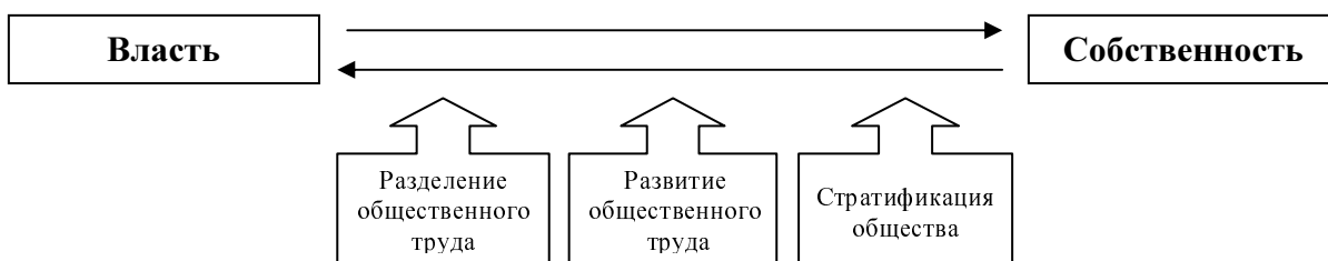
Рисунок 1. Основные факторы обособления и внешнего взаимодействия власти и собственности

Обособление и внешнее взаимодействие власти и собственности обретают зрелые формы в системе капиталистического способа производства. Это обеспечивается совокупностью связанных друг с другом факторов (рис. 1).