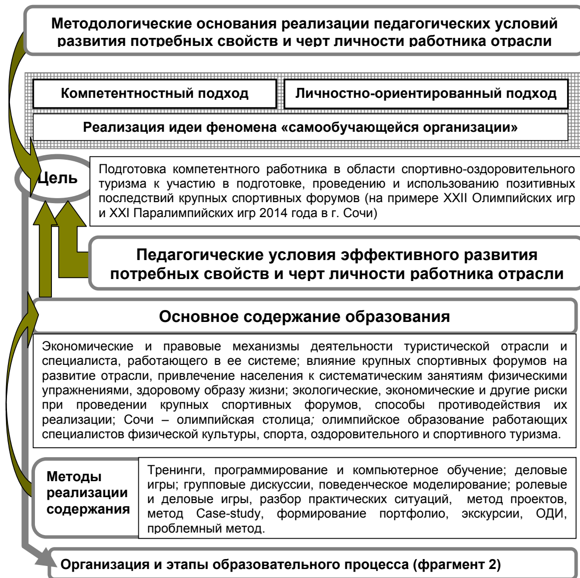
Рис. 1. Модель подготовки компетентного работника в области спортивно-оздоровительного туризма к использованию позитивных последствий крупных спортивных форумов (фрагмент 1)