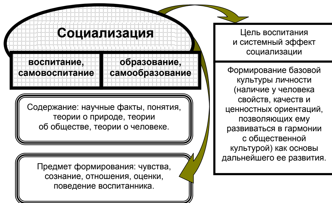
Рис. 1. Концептуальная схема социализации человека

Состав базовых средств и базовых знаний представляет собой базовую физическую культуру. Однако базовая физическая культура представляет собой лишь составной компонент физической культуры, поэтому ее воздействие приводит не к формированию личностной физической культуры, а лишь к формированию базовых ее составляющих.