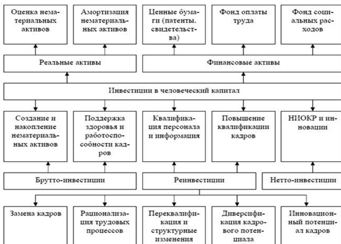
Рисунок 2. Структура и виды инвестиций в человеческий капитал

— возможности потери части рынка, роста продаж конкурента и усиления его влияния на рынке;