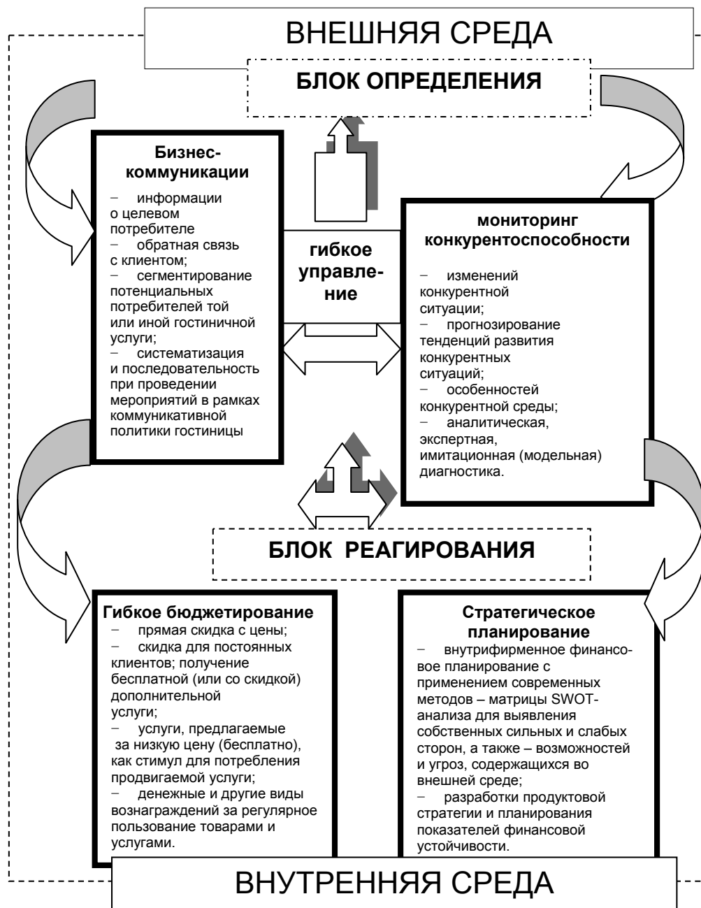
Рисунок 2. Схема модернизационных инструментов гибкого управления гостиничным бизнесом