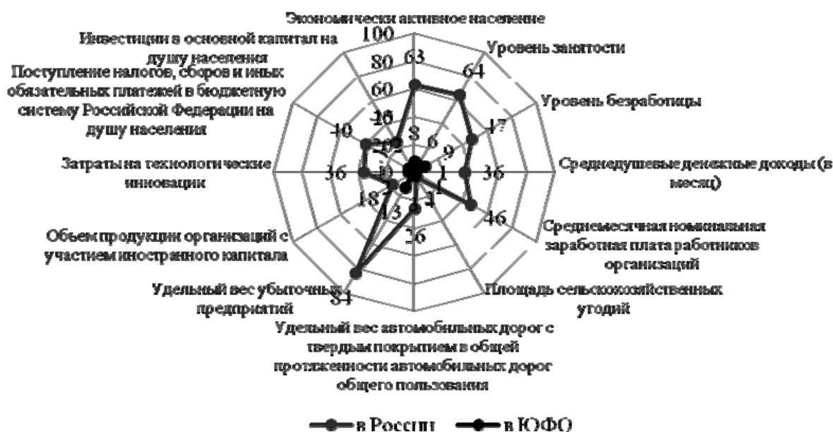
Рисунок 1. Графическое представление рейтинга факторов развития в сравнении по России и Южному федеральному округу

Среди факторов, препятствующих реализации потенциала развития Краснодарского края, следует выделить: старение и естественную убыль населения; значительную степень физического и морального износа основного оборудования предприятий края; недостаток энергоресурсов и высокую зависимость края от цен на энергоносители; отставание развития дорожно-транспортной сети при росте грузовых и пассажирских потоков; недостаточную конкурентоспособность продукции, товаров и услуг краевых товаропроизводителей; недостаток современных