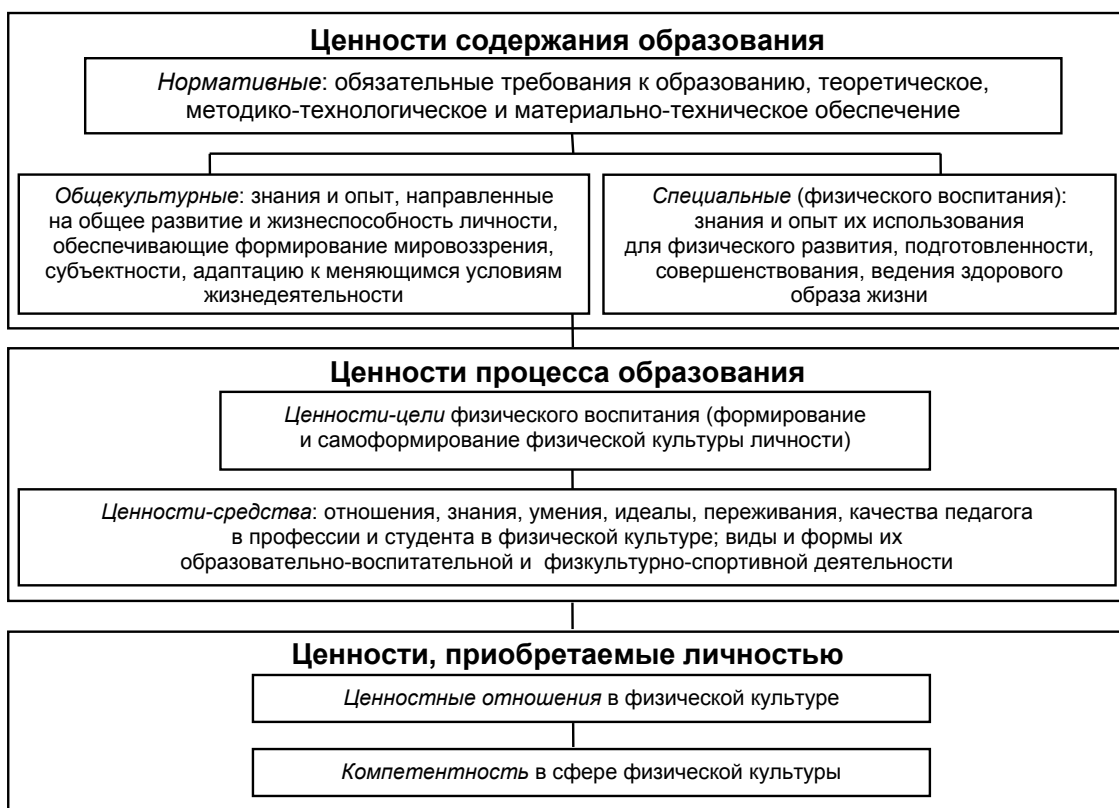
Рис. 1. Структура ценностей формирования физической культуры студента в образовательном процессе вуза

Ценности содержания образования через его процесс трансформируются в ценности личности, которые оказывают влияние на процесс и содержание