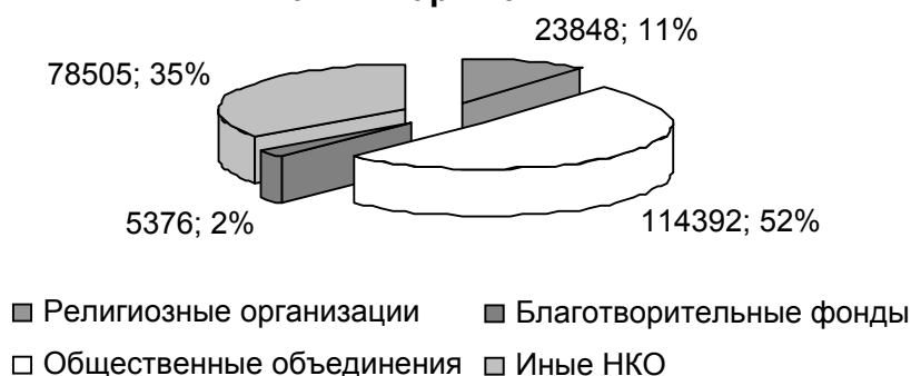
Рисунок 2. Состав некоммерческих организаций по данным Минюста России

Анализ российского законодательства и правоприменительной практики показал, что в России существует целый ряд проблем, связанных с применением различных положений нормативно-правовых документов некоммерческими организациями. В мае 2005 г. в Государственной Думе директором ФСБ Н.П. Патрушевым было предложено усиление правового регулирования деятельности НКО: «Несовершенство законодательной базы и эффективных государственных механизмов контроля создают почву для проведения разведывательных акций под видом благотворительной и иной деятельности». Необходимость законодательного упорядочения деятельности НКО также обосновывалась непрозрачностью финансирования НКО и расходовании ими получаемых средств; использованием НКО для легализации доходов и ухода от налогообложения; попытками внешнеполитического влияния на внутреннюю обстановку в России посредством НКО; их ролью в «цветных революциях» в странах СНГ;