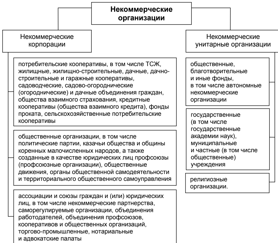
Рисунок 3. Структура некоммерческих организаций согласно проекту ГК РФ

будут существовать только в форме некоммерческих [3]. Таким образом, предполагаемая структура некоммерческих организаций может быть представлена схематично в следующем виде (рис. 3):