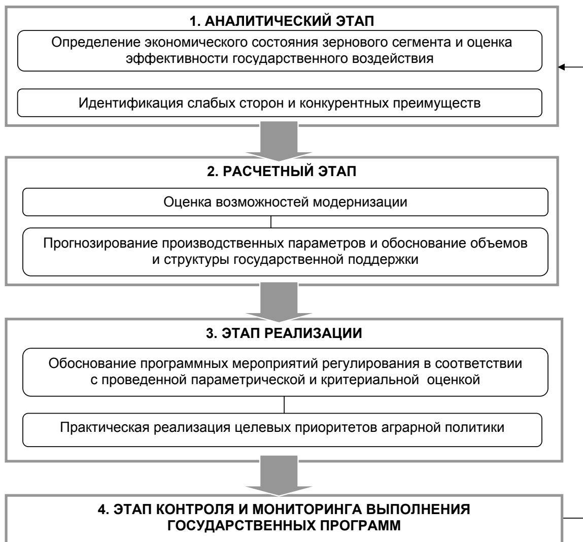
Рисунок 3. Алгоритмическая модель реализации программ государственного управления и регулирования зернового сегмента агропродовольственного рынка

Основные этапы реформирования системы государственного управления и регулирования зернопродуктового рынка представлены в виде алгоритма на рисунке 3.