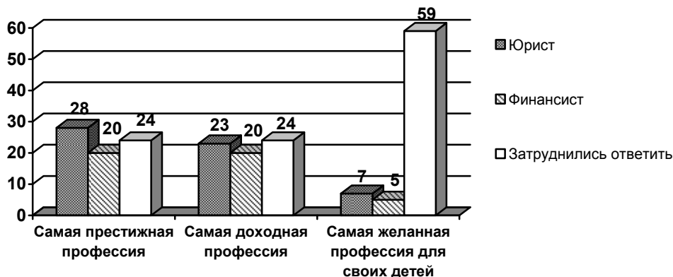
Рис. 2 Привлекательность профессий в 2006 году

пожелали бы для своих детей? По всем трем вопросам наибольший процент получила юридическая сфера: 28% опрошенных считают эту работу самой престижной, 23% — самой доходной, а 7% опрошенных пожелали бы эту профессию своим детям. Несколько меньше процентов набрали финансисты и экономисты: 20% опрошенных считают такую работу самой престижной, 12% — самой доходной, 5% хотели бы дать такую профессию своим детям. Причем данные профессии стабильно удерживают позиции. Год назад, когда респондентам предлагали ответить на третий вопрос, 6% родителей видели своих детей юристами и 6% мечтали для своего ребенка о карьере финансиста. Распределение ответов респондентов представлено на рис. 1.