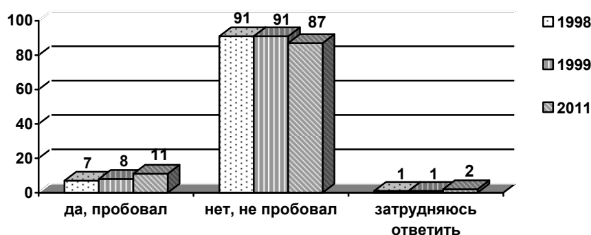
Рис. 1 Вы хотя бы раз в жизни пробовали какой-нибудь наркотик?

Большинство практических исследований свидетельствуют о динамике роста наркомании. Например, согласно данным, полученным ФОМ в ходе исследований 1998, 1999 и 2011 годов, число людей, не пробовавших наркотиков, уменьшается. Соответственно, увеличивается процент тех, кто пробовал наркотические препараты хотя бы раз в жизни [3]. Распределение ответов респондентов представлено на рис. 1.