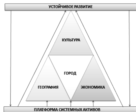
Рисунок 1. Платформа системных активов, обеспечивающая основные аспекты устойчивого развития

институты, театры, библиотеки, музеи) [3]. В этой связи в условиях Мирового финансово-экономического кризиса пути и принципы устойчивого развития современных городских территорий приобретают первостепенное значение (рис. 1).