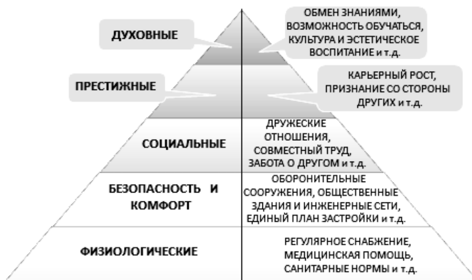
Рисунок 2. Пирамида потребностей жителей города и способы их удовлетворения

Городская среда способствовала развитию личности и общественных отношений. С одной стороны, город предоставил безопасность и возможность индивиду наиболее полно реализовать свои навыки и таланты. В городе нашли свое подкрепление все уровни иерархии потребностей человека по А. Маслоу [6] (рис. 2).