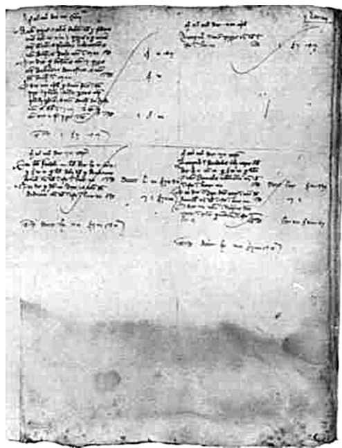
Рисунок 3. Счет перца Главной книги Генуэзской коммуны. Лист 73, согласно [7]

По утверждению Л.А. Руис, «счет коммуны Генуи выполнял функцию счета капитала. На него переносились сальдо всех счетов издержек и доходов при закрытии книги в конце года. Помимо шелка, и остальные счета товаров генуэзской коммуны, как это видно из книги, также закрылись с убытком. С другой стороны, прибыль возникала по другим сделкам, например, по векселям. Счет прибыли/убытка был перенесен с убытком в 3055.12 лир» на дебетовую сторону счета «Expensarum» communis Janue». В Главной, книге 1340 года, таким образом, мы видим использование двойной записи. Этот регистр 1340 г. содержит сбалансированные данные,