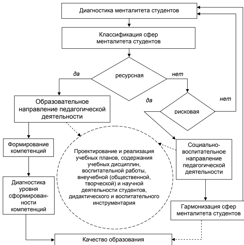
Рисунок 2. Алгоритм использования ресурсного потенциала студенческого менталитета для формирования компетенций

ставлять содержание работы непосредственно кураторов академических групп. Воспитывающее просвещение и обучение могут составить содержание работы как кураторов, так и преподавателей учебных дисциплин.