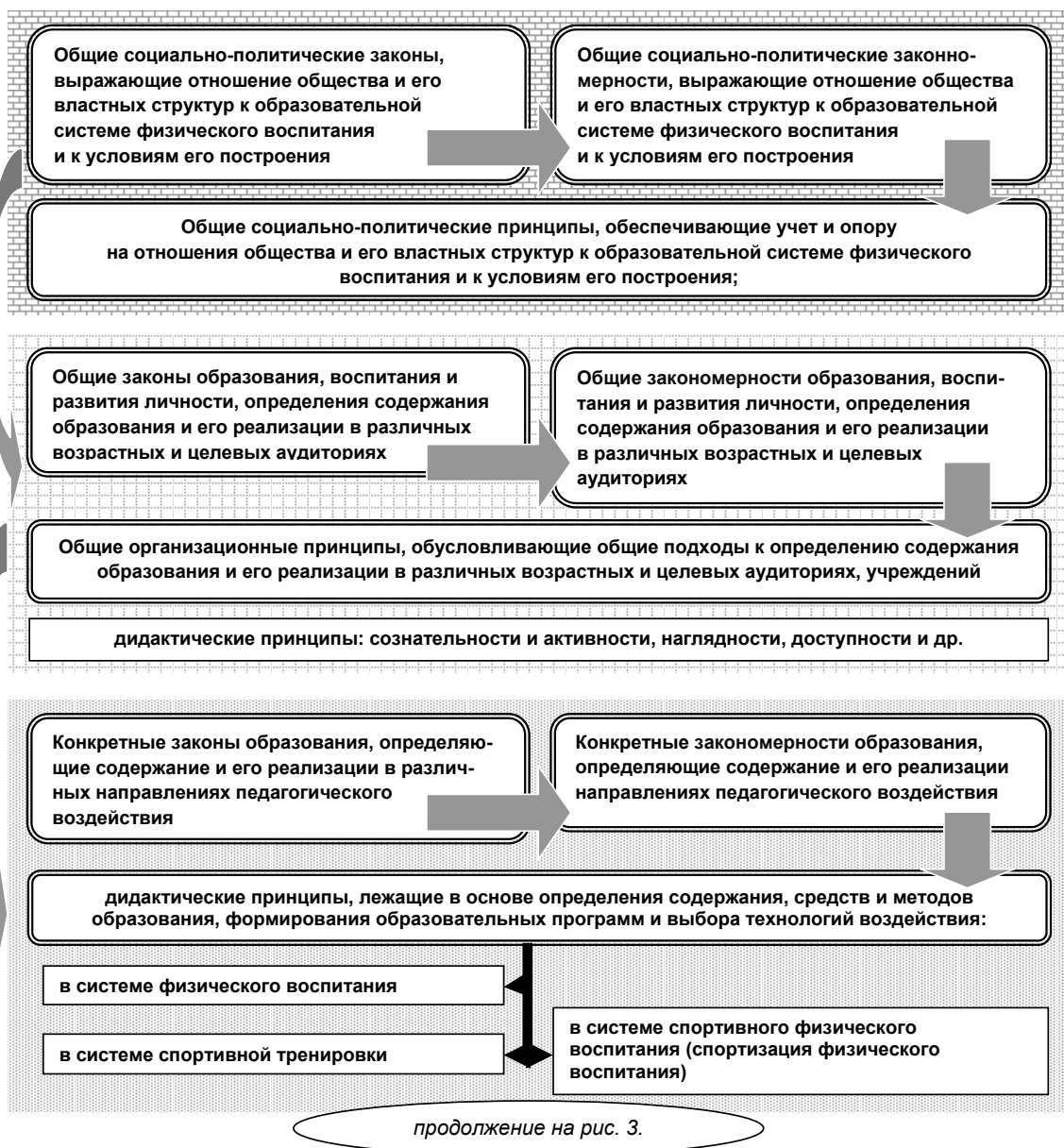
Рис. 2. Иерархия принципов физического воспитания и спортивной тренировки (фрагмент 2).