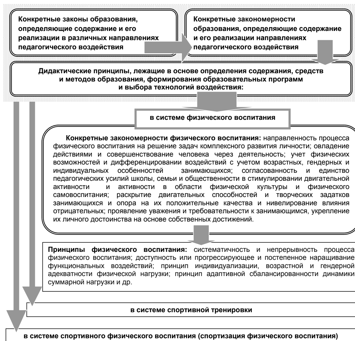
Рис. 3. Иерархия принципов физического воспитания и спортивной тренировки (фрагмент 3)