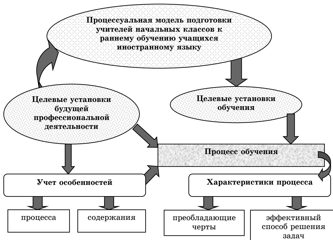
Рис. 1. Принципиальная схема процессуальной модели подготовки учителей начальных классов к раннему обучению учащихся иностранному языку в системе профессиональной переподготовки

подготовки позволяет создать ее процессуальную модель (рис. 1), которая представляет собой структурно построенную в иерархическом порядке систему, включающую в себя блок целевых установок обучения, определяемых за счет выявления целевых установок будущей профессиональной деятельности.