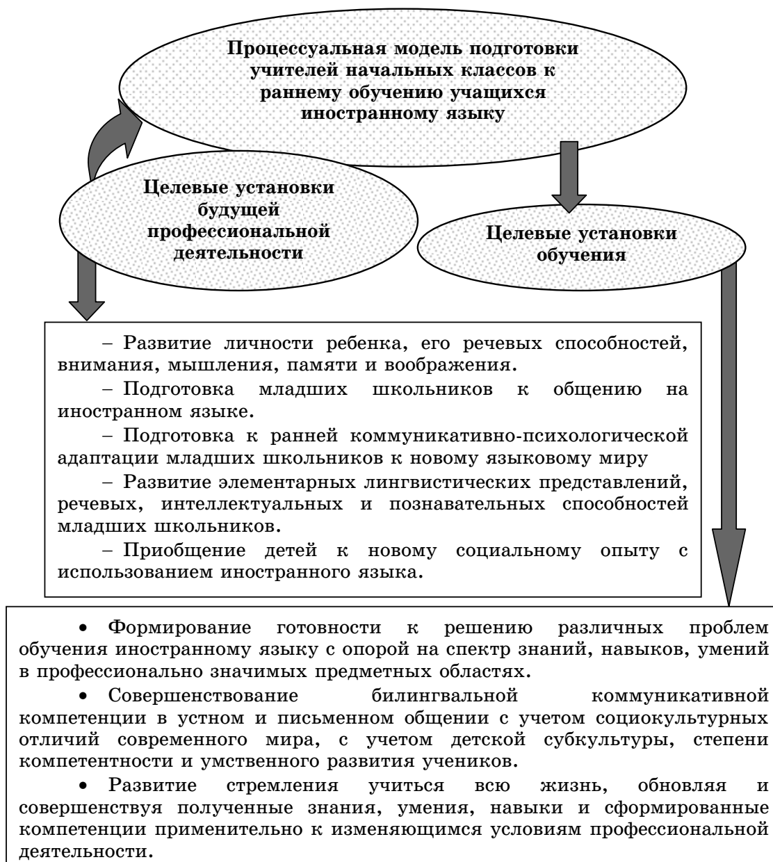
Рис. 2. Целевые установки как системообразующий фактор процессуальной модели профессиональной переподготовки учителей начальных классов к раннему обучению учащихся иностранному языку

личием у обучающихся лингвистического барьера, жизненного и профессионального опыта, билингвизм и связанное с этим расхождение тезаурусов, возможностью использования сформировавшейся рефлексии собственного образа «Я», соотношения реального и идеального «Я», ориентированностью на профессиональную деятельность и определенностью своего места в мире, высоким уровнем