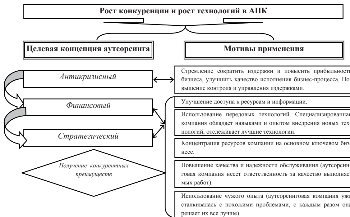
Рисунок 3. Целевая концепция и мотивы применения аутсорсинга

Аутсорсинг может возникнуть во всех формах, видах и подвидах разделения труда: от технического на предприятии, когда производственные процессы передаются аутсорсинговым компаниям, до международного, когда аутсорсинговые компании действуют на международных рынках. Различные формы и сферы аутсорсинга в полной мере раскрывают все богатство возможностей для применения данной модели хозяйствования на современном этапе развития в российской агроэкономике [3].