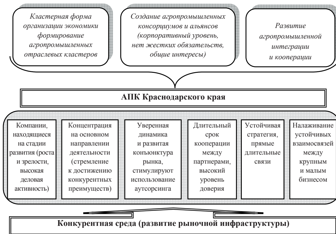
Рисунок 2. Базовые постулаты аутсорсинговой модели хозяйствования в АПК

тва, племенного животноводства, садоводства и возделывания плодовоовощных культур;