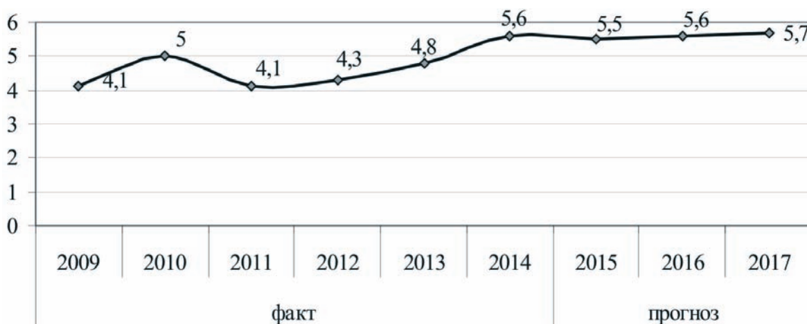
Рисунок 2. Налоговые поступления от предприятий курортно-туристского комплекса в бюджет Краснодарского края

нию, составляет около 10% от фактического числа квартиродатчиков.