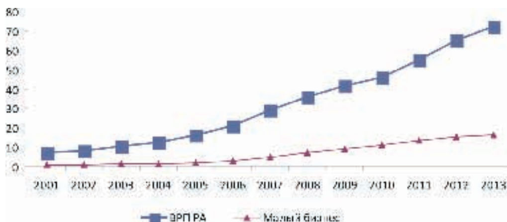
Рисунок 2. Производство ВРП, объем производства и услуг в малом бизнесе Республики Адыгея в 2001—2013 гг., в текущих ценах, млрд р.

ние может со временем привести к деформации структуры экономики республики и значительному снижению эффективности ее функционирования.