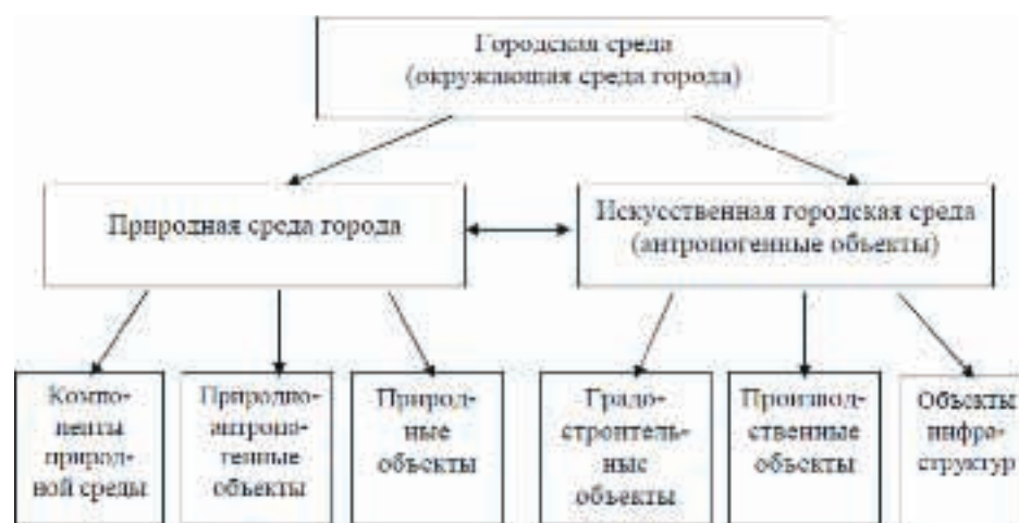
Рисунок 1. Структура городской среды [1]

сущие компонентам природной среды. На рисунке 1 показана структура городской среды как окружающей среды города.