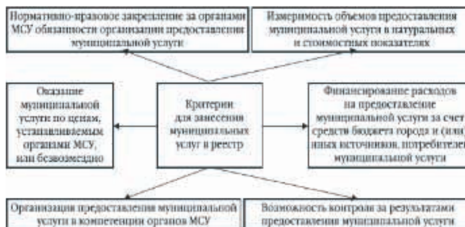
Рисунок 2. Условия для занесения муниципальной услуги в реестр [7]

условиями качества, удовлетворяющими население. При этом, в соответствии с законодательством, каждый орган системы муниципального управления обязан сформировать реестр муниципальных услуг с описанием оснований и условий их предоставления, непосредственных поставщиков и потребителей (получателей и заявителей). Условия для занесения муниципальной услуги в реестр представлены на рисунке 2.