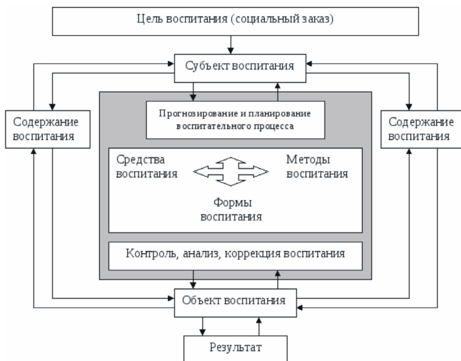
Рисунок 4. Алгоритм воспитания личности

Необходимыми условиями для достижения нового и современного качества общего образования будут являться: