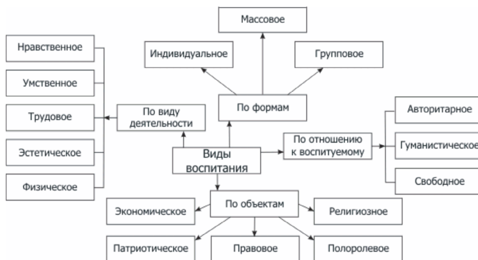
Рисунок 3. Виды и формы воспитания личности

Опираясь на богатый опыт российской и советской школы, на наш взгляд, следует сохранить лучшие традиции отечественного естественно-математического, гуманитарного и художественного образования. Воспитание, будучи первостепенным элементом в образовании, должно стать органичной составляющей всей педагогической деятельности, интегрированной в общий процесс обучения и развития личности. Виды воспитания представлены на рисунке 3.