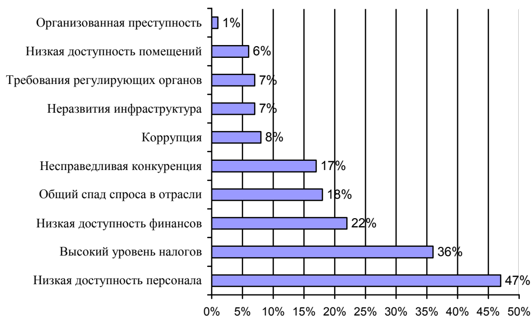
Рисунок 3. Уровень коррупции, с которым сталкиваются предприниматели в различных сферах, в % [7]

ществом. Следовательно, формирование института взаимной лояльности должно быть инициировано властью и поддержано субъектами бизнеса.