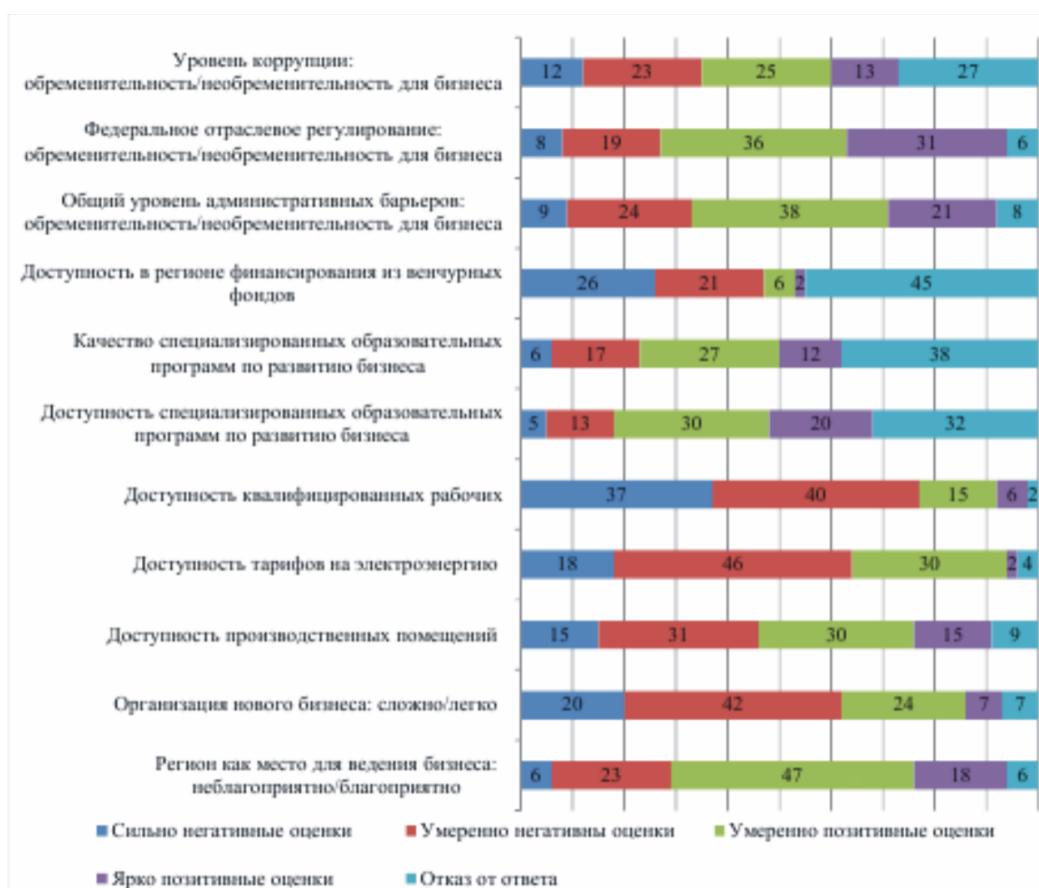
Рисунок 2. Исследование предпринимательского климата в России для малого и среднего предпринимательства за 2012 г., в % [7]

ли препятствия для развития бизнеса в Российской Федерации (рисунок 2).