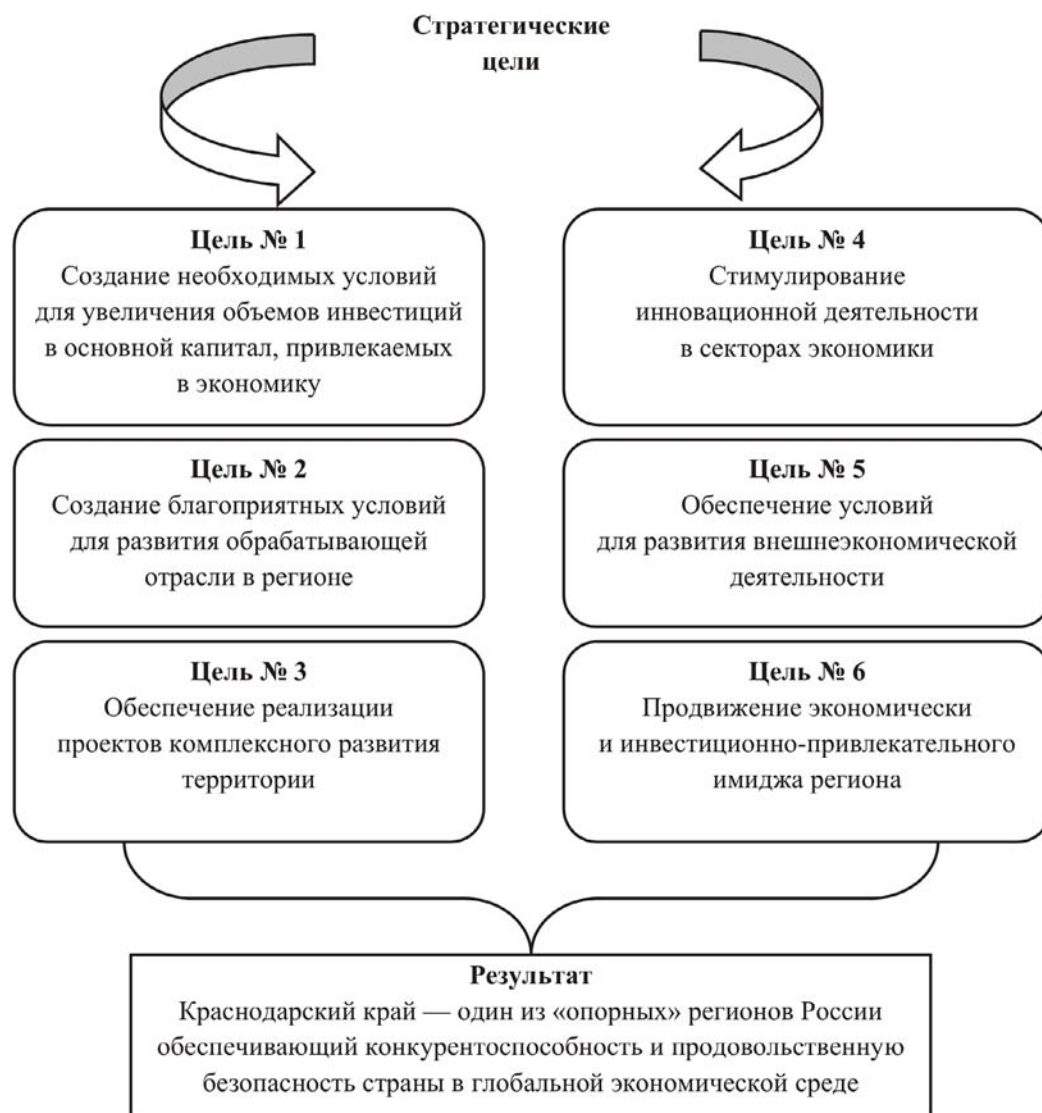
Рисунок 2. Стратегические цели развития благоприятного инвестиционного климата Краснодарского края [8]

ния инвестиций необходимо осуществить ряд задач: