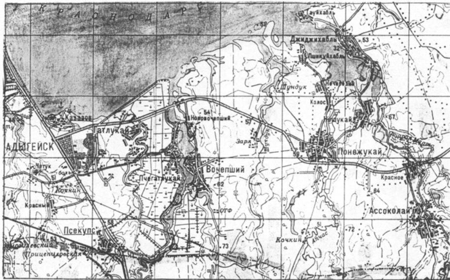
Рис. 2. Аульное расселение в центральной части Теучежского района

Пример отчетливо выраженного приречного расселения на рисунке 3 – аульно-хуторского в северной части и станично-сельского в южной. Крупные населенные пункты и примыкающие к ним хутора создают почти не расчлененные ленты расселения по обеим сторонам реки Фарс. На притоках Фарса, таких как Чехрак, аулы и дочерние хутора образуют хорошо выраженные ленточные формы расселения. В пространстве между такими приречными «лентами» поселений расположены сезонно обитаемые пункты, а расстояния от одного «каркасного» населенного пункта до другого могут быть больше 10 км.