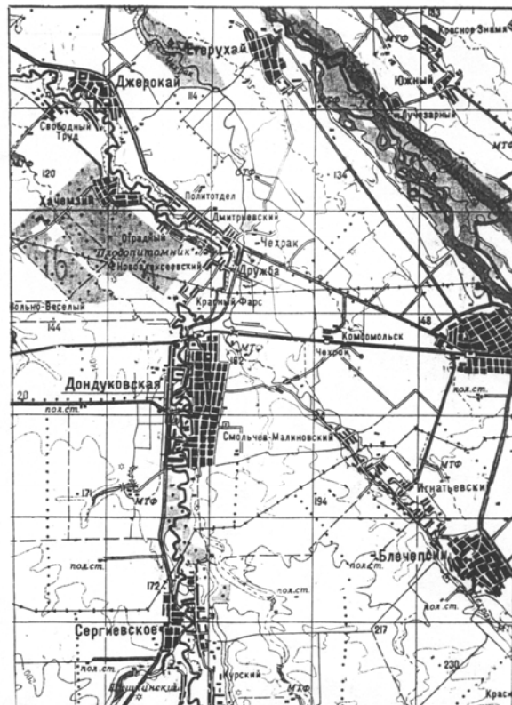
Рис. 3. Аульно-хуторское и станично-сельское расселение в междуречье рек Фарс и Чехрак

Пример отчетливо выраженного приречного расселения на рисунке 3 – аульно-хуторского в северной части и станично-сельского в южной. Крупные населенные пункты и примыкающие к ним хутора создают почти не расчлененные ленты расселения по обеим сторонам реки Фарс. На притоках Фарса, таких как Чехрак, аулы и дочерние хутора образуют хорошо выраженные ленточные формы расселения. В пространстве между такими приречными «лентами» поселений расположены сезонно обитаемые пункты, а расстояния от одного «каркасного» населенного пункта до другого могут быть больше 10 км.