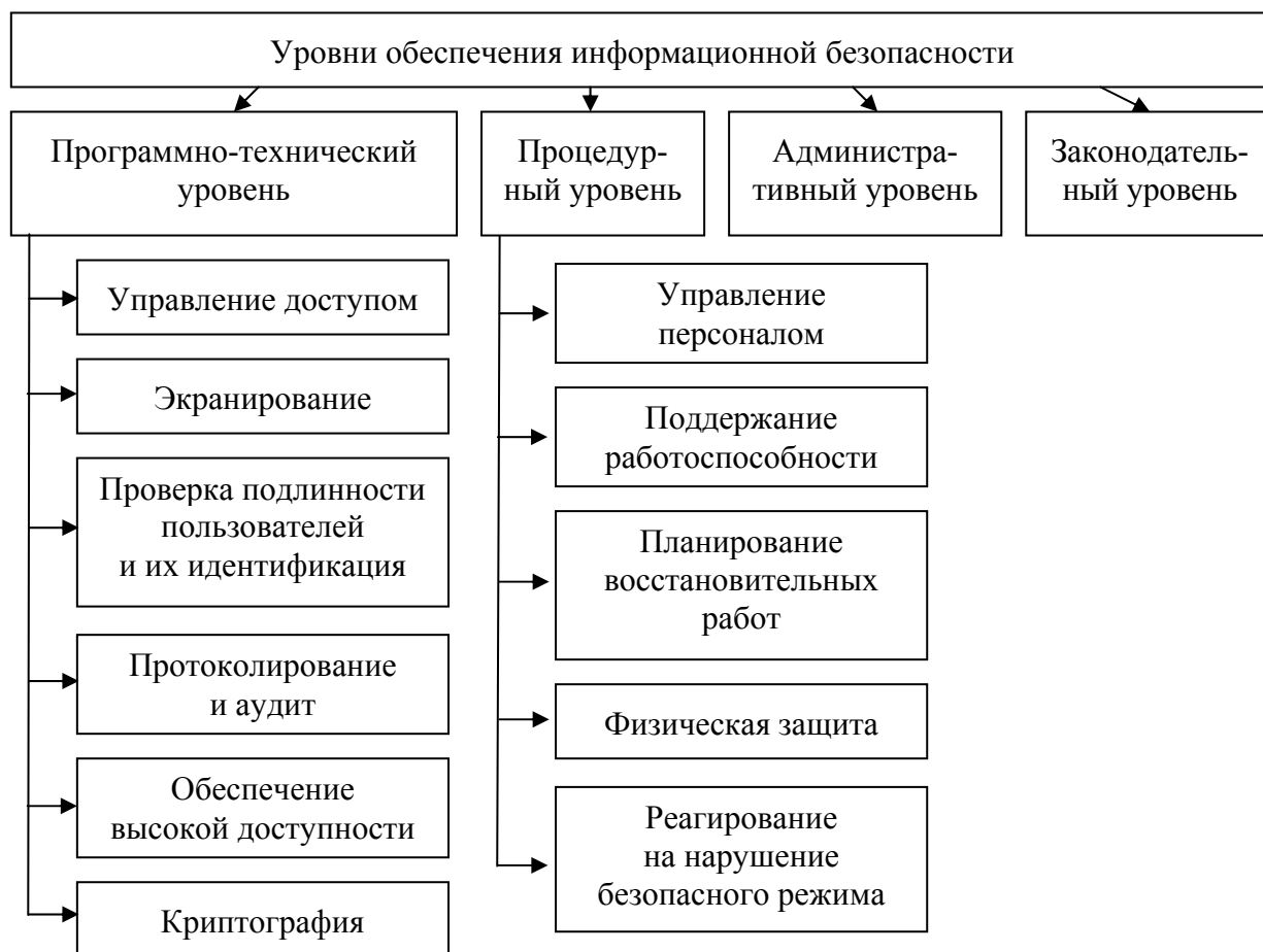
Рис. 1. Уровни обеспечения ИБ

стройками средств защиты информации; несанкционированное изменение конфигурационных файлов и настроек средств защиты информации; нарушение режимов функционирования программно-технических средств информационной системы и изменение функциональных элементов и их корректной реакции на соответствующую операцию.