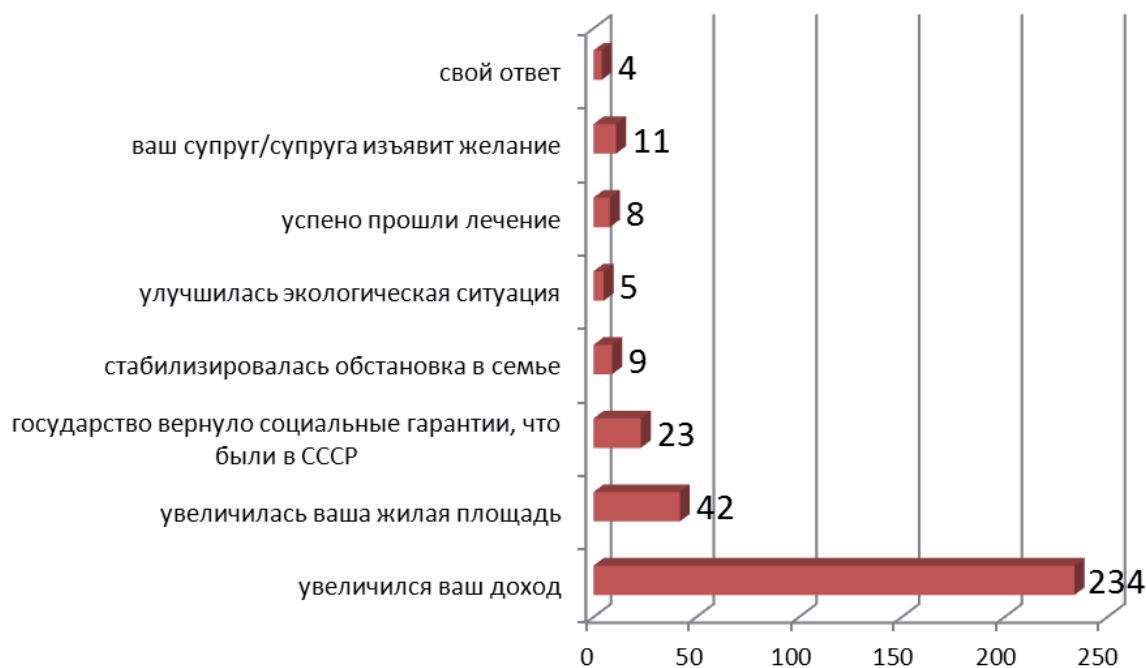
Рисунок 3. Распределение ответов опрошенных на вопрос: «Хотели бы Вы ещё детей, если бы у Вас изменились представленные ниже условия?»

Ответы респондентов, полученные в ходе опроса, свидетельствуют: большинство жителей Адыгеи ориентированы на многодетный брак, многодетную семью (с тремя детьми). Основными препятствиями в реализации их репродуктивных установок являются социально-экономические причины, в первую очередь крайне низкий уровень дохода, отсутствие социальных гарантий, неуверенность в завтрашнем дне (рис. 3). Следующая по значимости причина – это не устраивающие