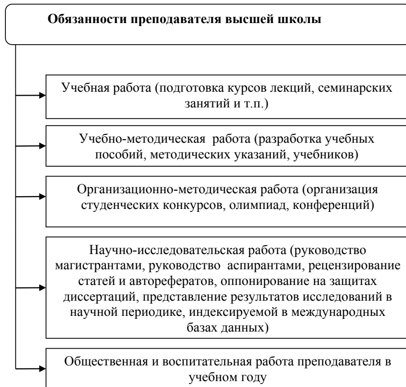
Рис. 3. Обязанности преподавателя высшей школы [3]

Профессия «Преподаватель высшей школы» обладает определенными специфическими социально-экономическими особенностями. В системе высшего образования необходимо наличие таких благ, с помощью которых человек способен выбрать карьеру преподавателя высшей школы. Так, например, в американских вузах это связано с возможностью занятия постоянной штатной должности профессора, которая гарантирует высокую заработную плату на протяжении длительного периода времени (в среднем на протяжении 25 лет), наличие высокого пенсионного обеспечения и защиты от увольнения [5]. В России в советское время, когда