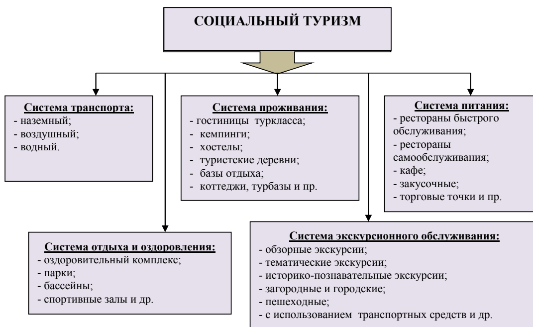
Рис. 2. Система социального туризма

питание, а также на транспорт и услуги по развлечению и оздоровлению данного вида туристов.