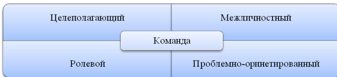
Рис. 2. Подходы к формированию команды

Межличностный подход нацелен на отношения между людьми в группе. Группа как команда в большей степени существует благодаря межличностной компетентности. Цель данного подхода заключается в увеличении группового доверия, в поощрении совместной поддержки,