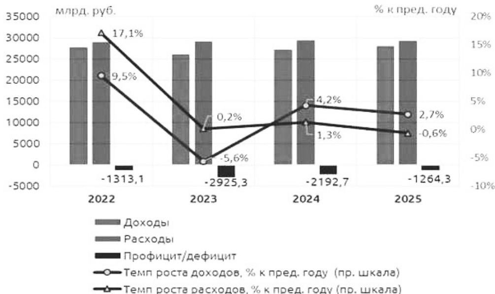
Рис. 3. Динамика доходов и расходов федерального бюджета в 2023-2025 гг., млрд. руб., % (составлено авторами по источнику [11])

На рис. 3 представлены доходы, расходы и дефицит/профицит федерального бюджета на 2023-2025 гг.