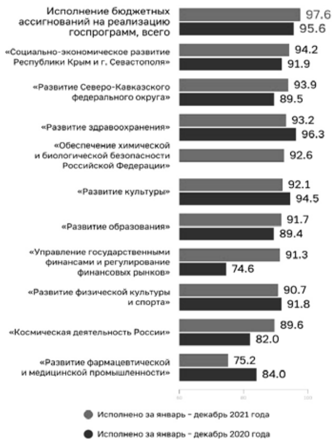
Рис. 1. Исполнение расходов федерального бюджета Российской Федерации по государственным программам за 2020-2021 гг., % [7]