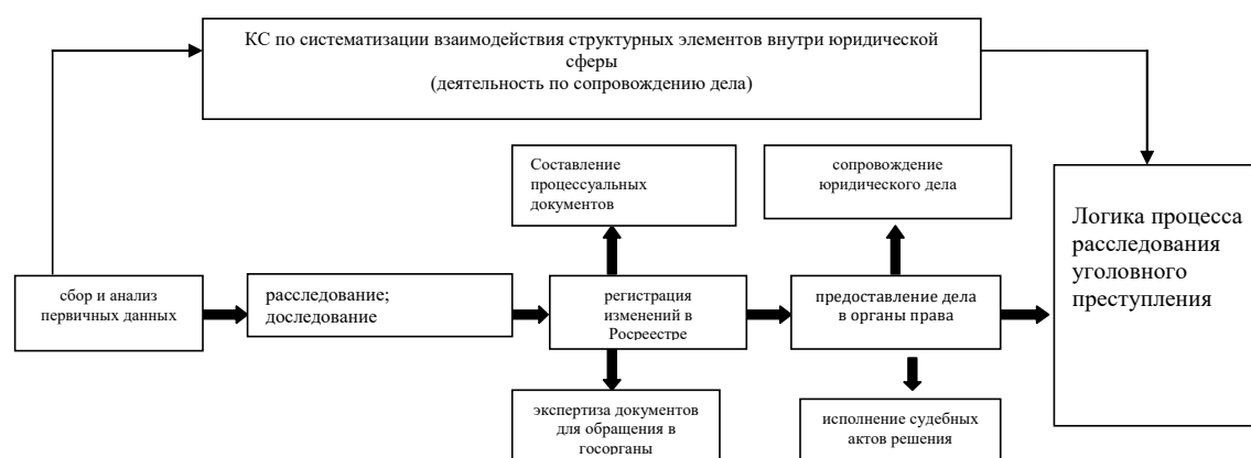
Рисунок 2. Структурные элементы процесса сопровождения материалов дела