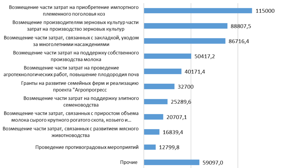
Рис. 3 — Состав мероприятий, реализуемых в рамках подпрограммы «Развитие отраслей АПК» Республики Адыгея в 2022 г., тыс. руб.

В структуре финансирования организационно-экономических мероприятий господдержки АПК Республики Адыгея в 2022 г., предусмотренных подпрограммой «Развитие отраслей АПК», основную долю составляет возмещение затрат на приобретение племенного поголовья коз (20,96%), затрат на производство зерновых культур (16,19%), затрат на закладку и уход за многолетними насаждениями (15,81%), затрат на поддержку собственного производства молока (9,19%) (рис. 3).