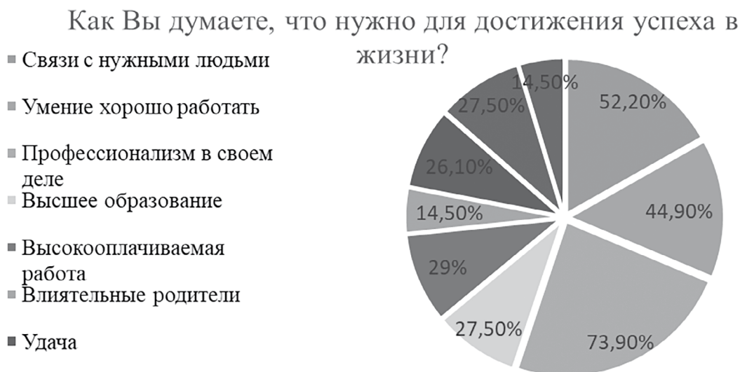
Диаграмма 3. Характеристика способов достижения социального успеха в студенческой среде

респондентов предпочитают посещать спортивные залы (секции), а 40,6% — кино-театры, 26,1% опрошенных занимаются творчеством, что демонстрирует наличие разнообразной культурно-досуговой жизни, которая фундируется ценностными представлениями молодежи о своем месте в обществе (см. диаграмма 4).