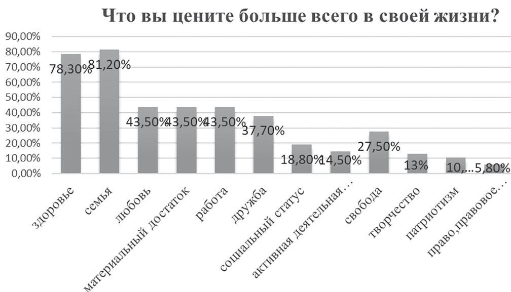
Диаграмма 1. Терминальные ценности современной студенческой молодежи

Тем не менее, результаты социологического опроса свидетельствуют о том, что традиционные ценности по-прежнему сохраняют в студенческой среде свою актуальность и важность. Вместе с тем аксиологическая система молодежи постепенно наполняется утилитарно-прагматическим содержанием, что и видно из диаграммы 1.