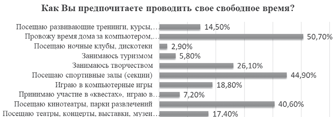
Диаграмма 4. Досуговые предпочтения студенчества

Заключение. Таким образом, полученные результаты вписываются в логику бинарного развития социального пространства молодежи, которое предполагает воспроизводство утилитарных ценностей в мире общественных отношений и трансляцию гедонистических установок в досуговых практиках. В совокупности два указанных вектора образуют утилитарно-гедонистический тип личности и задают стратегию позиционирования студенчества в образовательной среде, превращающей университет в инструмент получения пользы, достижения прагматических результатов, интеллектуального развития и удовлетворения от выстраиваемых межличностных коммуникаций. Данная конфигурация ценностных смыслов определяет жизненные стратегии молодых людей на перспективу и насыщает прагматическим содержанием аксиологическую структуру базовых социальных институтов, к числу которых относятся образование, культура и семья.