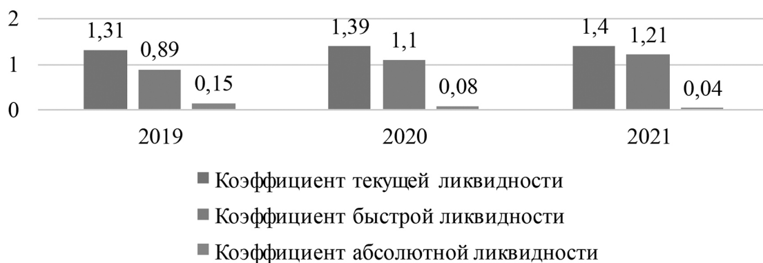
Рис. 1 — Динамика основных показателей финансовой платежеспособности ООО «Уралстилкомплект», %

Важное значение для повышения эффективности деятельности предприятия имеет анализ финансовых показателей.