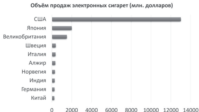
Рисунок 3. Объём продаж электронных сигарет. Figure 3. The volume of sales of electronic cigarettes.

В силу того, что предостеречь человека от какой-либо зависимости гораздо проще, чем избавиться непосредственно от пагубной склонности, этап социально-педагогической профилактики является необходимым в проблеме вейпинг-зависимости и требует применения необходимых мер в профилактике вредных привычек. Чем раньше начат процесс профилактики, тем эффективнее будет его результат.