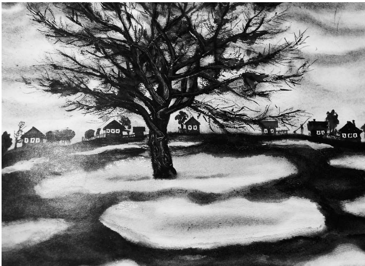
Рисунок 4. Г. А. Мамилов. Деревня на Байкале. 1986. Бумага, акварель.