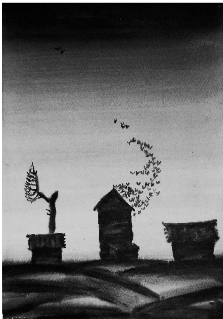
Рисунок 5. Г. А. Мамилов. Окраина деревни . 1996. Бумага, акварель.