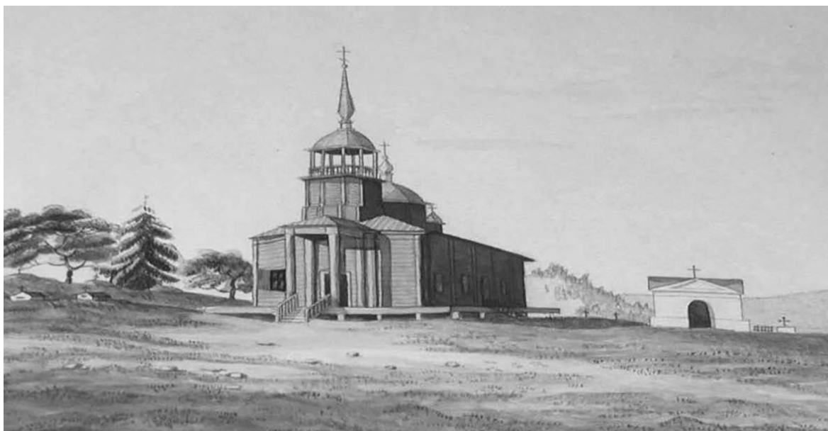
Рисунок 3. Н. А. Бестужев. Церковь и склеп Муравьевой в Петровском заводе.